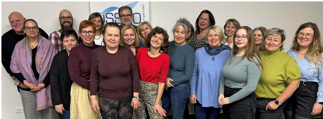
Účastnictvo pilotního workshopu